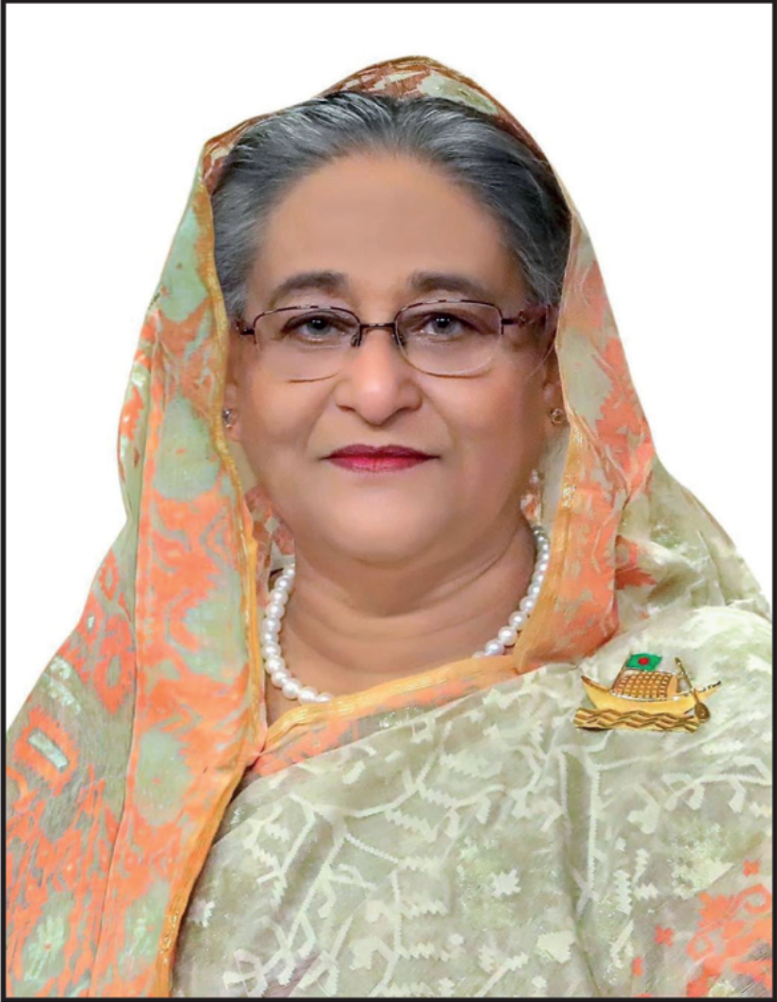
গণপ্রজাতন্ত্রী বাংলাদেশ সরকারের মাননীয় প্রধানমন্ত্রী